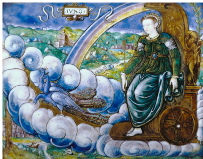
Ил. 4. Леонар Лимозен. Екатерина Медичи в образе Юноны, 1573 г., полихромная эмаль на меди и серебре, 16,8 x 22,9 см. Музей Пола Гетти, Лос-Анджелес

Следует отметить, что повествование Симонетты временами несколько калейдоскопично: действующие лица сменяют друг друга, так что прилагаемое генеалогическое древо Медичи окажется читателю весьма полезным, чтобы разобраться в родственных связях упоминаемых героев. Может показаться, что к некоторым из них автор весьма критичен, как и к их ближайшему окружению. Так, когда Симонетта в очередной раз настаивает, что Макиавелли непременно попал в ад (с. 20, 47), читатель может принять легкую подачу материала за некоторую предвзятость. То же и с «ярлыками» отдельных персонажей, будь то «уродливая Элеонора» (с. 37), «болтливый посол» (с. 50) или «похотливый власти-