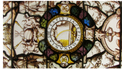
Ил. 3. Неизвестный мастер. Эмблема Екатерины Медичи с изображением радуги, ок. 1549–1552 гг., витраж. Замок Экуан (фрагмент)

Пожалуй, одной из лучших иллюстраций сложности иконографии этого периода может служить образ радуги, ставшей частью репрезентации королевы. Этот мотив органично соединил в себе как античные аллюзии (обращение к образу Юноны 15 ), так и библейские (ил. 3–4).