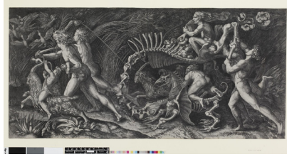
Ил. 2. Агостино Венециано. Lo Stregozzo (фрагмент)

Пожалуй, одной из лучших иллюстраций сложности иконографии этого периода может служить образ радуги, ставшей частью репрезентации королевы. Этот мотив органично соединил в себе как античные аллюзии (обращение к образу Юноны 15 ), так и библейские (ил. 3–4).